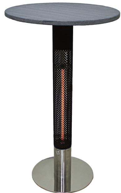
TABLE M ET0048

Hmotnost: 20 kg Výška: 110 cm Průměr základny : 40 cm Výkon: 2000 W Krytí : IP 55 Délka přívodního kabelu: 1,9 m